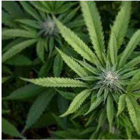
ตะนาวศรีก้านขาว

ลักษณะของช่อดอกเป็นกระจุก แน่นที่ปลายกิ่ง มีช่อดอกจำนวนมาก มีทรงต้นที่เป็นพุ่ม และมีกลิ่น ที่เฉพาะตัว หอมคล้ายเปลือกส้ม ผสมกลิ่นตะไคร้ มีกลิ่นฉุนน้อยกว่า พันธุ์หางเสือ