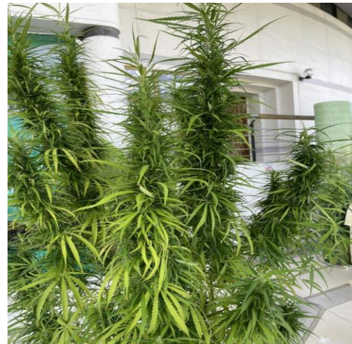
ทางกระรอก

“ไทยสติ๊ก (Thai Stick)” ขึ้นชื่อว่าเป็นหนึ่งในสาย พันธุ์ที่ดีที่สุดในโลก มีสาร THC สูงมาก นิยมใช้ ในการรักษาอยู่ในระดับสูง 18-22 % ช่วยให้รู้สึก เคลิ้ม ลดความเครียด ช่วยให้เจริญอาหาร